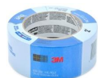
3M BT 48mmx54,8m