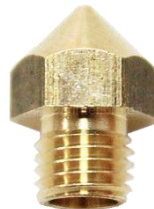
Сопло 0.3 мм